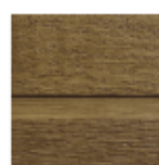
Bois de Santal