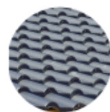
Double Romane Noire