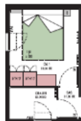
Chambre + cellier