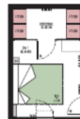
Chambre + dressing