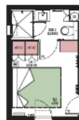
Chambre + SDE